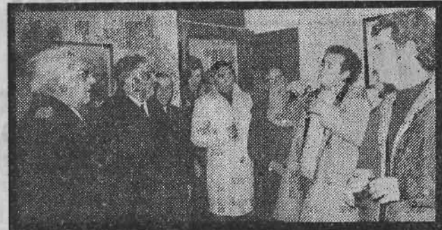
El capitán del «Yebala», que participó directamente en las tareas de rescate, explica las circunstancias de la operación en la Comandancia de Marina

Tenía que estar repartida en varias bodegas pequeñas y no en una sola