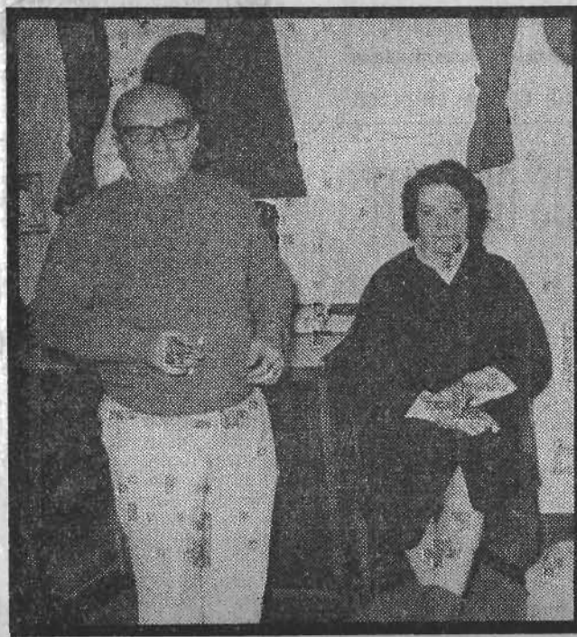
El engrasador, con su mujer, la única que viajaba en el barco naufragado

Las causas del hundimiento del «Ensidesa» parece que están claras. El fuerte oleaje escoró la carga, formada por mineral parecido a arena mojada,