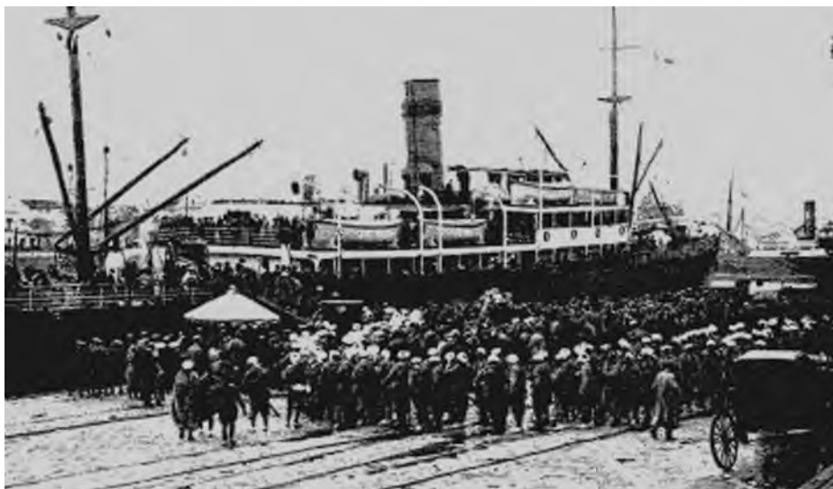
Sevilla 22 de octubre de 1922. Salida de los Regulares en el Escolano.